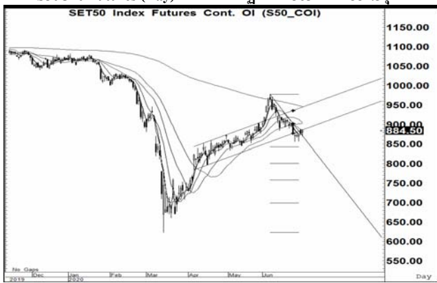
S50U20 Futures (Day) วันที่ 1 กรกฎาคม 2563 ปิดที่ 884.5 จุด

ปัจจัยที่ติดตามในระยะสั้น คืนนี้ติดตามตัวเลขจ้างงานนอกภาคเกษตรและอัตราว่างงานสหรัฐประจำเดือนมิ.ย. ทั้งนี้ตลาดคาด 3 ล้านรายและ 12.3% รวมทั้งจำนวนผู้ขอรับสวัสดิการว่างงานประจำสัปดาห์ ทั้งนี้ตลาดคาด 1.355 ล้านราย และวันศุกร์ตลาดหุ้นสหรัฐปิดทำการเนื่องจาก Independence Day